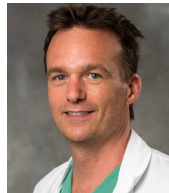
Pr Eloi MARIJON Université de Paris

La majorité des morts subites est inaugurale, c'est-à-dire survient chez des sujets « non-cardiaques » connus.